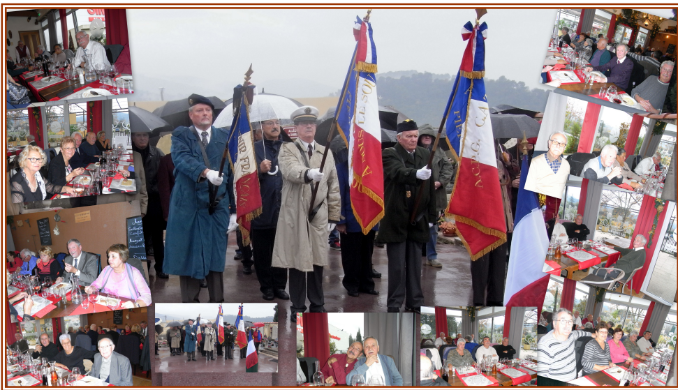
05 décembre 2015 Journée Nationale d'Hommage aux Morts de la guerre d'Algérie et des combats du Maroc et de la Tunisie suivi d'un repas à La Cranac