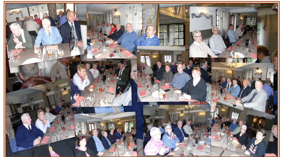
14 janvier 2016 suivi d'un amical repas à l'Crée du Bois au Muyl.