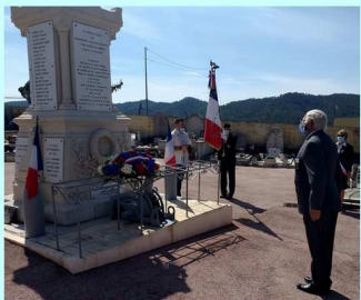
Cérémonie du 08 mai 2020