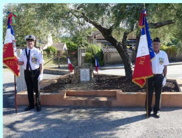
Appel du 18 juin 1940