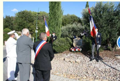
Hommage aux Harkis 25 septembre 2020