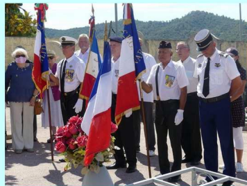
Cérémonie du 14 juillet 2020