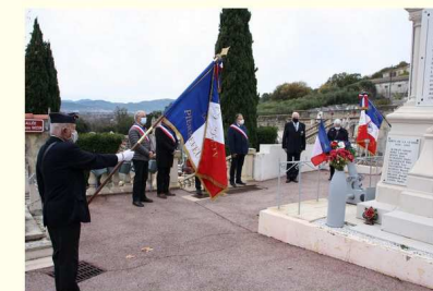
Hommage "aux morts pour la France" en Algérie - Maroc - Tunisie 05 décembre 2020