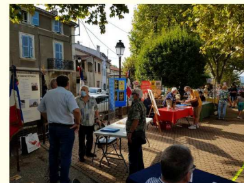
Forum des Associations le 12 septembre 2020